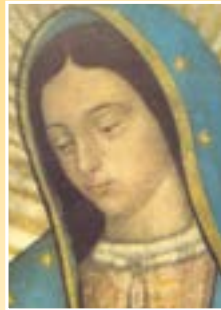
Our Lady of Guadalupe, Mexico - 9.12.

Papst Johannes Paul II. hat unsere Patronin auf dem WJT 1997 in Paris zur Kirchenlehrerin erhoben, obwohl sie nur 24 Jahre alt wurde und keine großen Werke verfasst hat. Von ihr können wir den "kleinen Weg" des kindlichen Vertrauens lernen, der uns ganz sicher in den Himmel führt. Sie sagt: "Meine Berufung ist es, im Herzen der Kirche die Liebe zu sein."