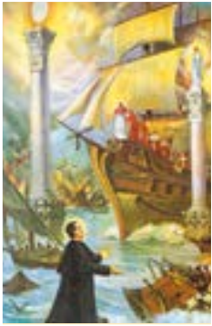
Hl. Don Bosco - 31.1.

Neben Jesus und Maria haben wir jede Menge Freunde im Himmel, die uns in allen Lebenslagen zur Seite stehen. Einige davon sind die Patrone unserer Bewegung weltweit .