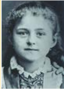
Hl. Thérèse von Lisieux - 1.10.

Er liebte seine Straßensjungs und sie liebten ihn. In seinem berühmten Traum sah er die Kirche als ein in Seenot geratenes Schiff, an dessen Bug der Papst als Steuermann steht. In größter Not macht er es an zwei Säulen fest. Auf der kleineren steht Maria, auf der großen die Eucharistie. Dies sind auch unsere Säulen.