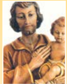
Hl. Josef - 19.3.

Ihr Gnadenbild in Mexiko zieht jährlich 20 Millionen Menschen an. Es war Ziel der ersten Reise Papst Johannes Paul II., der ihr den Titel „Stern der Neuevangelisierung“ gegeben hat. Von diesem Bild ging die Christianisierung Amerikas aus. Sie ist unsere Hauptpatronin.